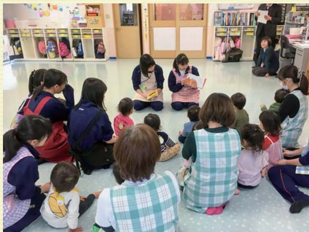
就学前児童対象の子育て支援ボランティア活動

ボランティアを始めようと思った時、その「最初の一歩」をどのように踏み出せば良いのでしょうか？たくさんあるボランティア団体にいきなり連絡することに不安を感じる方も多いと思います。そんな時は、ボランティア活動や団体の情報に詳しい、お住いの地域の社会福祉協議会・ボランティアセンターに相談してみたり、ホームページに掲載されるボランティア情報も「きっかけづくり」になるでしょう。