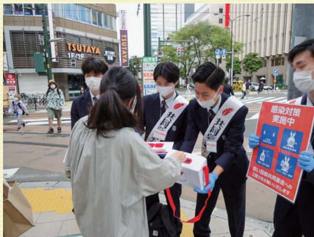
赤い羽根共同募金街頭活動

ボランティアは、 誰もが安心して豊かに暮らせる平和な社会を実現するための活動です。 様々な社会的課題が生じている今だからこそ、 日々のボランティア活動がとても重要な役割を果たします。 どんなに小さな気づきでもかまいません。 日常生活で気がついたことについて、 「自分にできることは何か」を考え行動することで、 社会を良い方向に変えていくことができます。 これがボランティアの醍醐味といえるでしょう。 ぜひ皆さんも、日常の小さな気づきを大切に、 自分の個性やひらめき、アイデアを大いに発揮して、 自分ができるボランティア活動に取り組んでみてください。